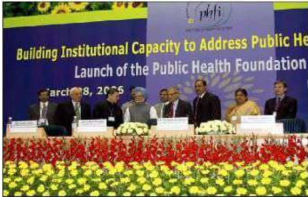
Autonomous public-private initiative, launched by the then Honorable Prime Minister of India, Dr. Manmohan Singh in March 2006 at New Delhi

Independent foundation, registered as a Society with initial funding from government, international foundations, private/other organizations